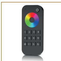
Pilot do taśm RGB Remote controller for RGB LED strips