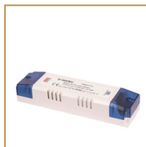
Zasilacz montażowy 80W Power supply 80W